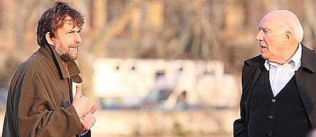
Режисерот Нани Морети и глумецот Мишел Пиколи за време на снимањето на „Хабемус Папам“.