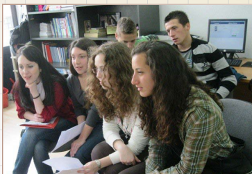
Младите во Охрид

На големиот број работилници, младите ги споделија своите искуства на темите за интер-културната мобилност и активно граѓанство и учеството на проекти со европска димензија. Учеството се зголеми особено за вре-