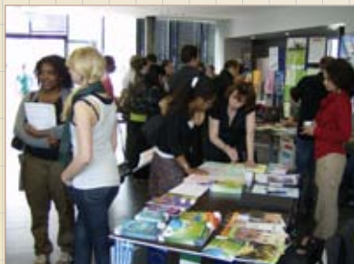
Работилница во Еровил

ме на видеоконференцијата со Македонија, односно со градовите: Прилеп, Охрид и Штип.