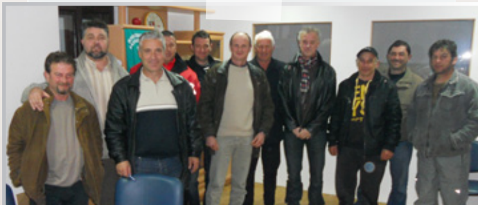
Средба на ФФРМ и АФДИ со ресенските производители на овшје во февруари 2011

Дел од обуката на македонските фармери е нивна посета во Франција. Овој престој е наменет за претставниците на пилот групите заедно со претставници на ФФРМ задолжени за придружба и следење на работата на пилот групите. Мисијата во Франција ќе се спроведе од 3 до 13 април. Во текот на посетата планирано е да се посетат тамошните фарми, да се увиди тамошниот начин на производство на млеко и сточна храна, односите помеѓу кооперативите, начинот на производство, преработка и складирање на јаболка, начинот на формирање на цената и откуп. На 7 април АФДИ го организира своето годишно собрание на кое претставниците од ФФРМ ќе учествуваат.