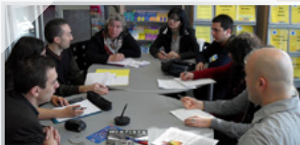
Тимот на СЕГА во работна посета на ДН - 2010

Тридневна работилница е предвидена во април во Долна Нормандија во организација на Европската куќа од Каен и Коалицијата на младински организации – СЕГА. Се работи за создавање на услови, во Македонија и во Долна Нормандија, за сите млади да можат заеднички да ги откријат можностите за образование и обука како и за вработување. Работилницата е наменета за локалните власти и одговорните за младински политики, за младинските работници, за младите вклучени во локалното управување (околу 12 учесници, 6 од Македонија и 6 од Долна Нормандија). Ова ја покажува потребата од подигање на свеста и на вистински дијалог меѓу самите млади и со институциите на локално, национално и европско скалило. Развивајќи се во поширок простор, ќе го збогатиме размислувањето и способностите на индивидите.