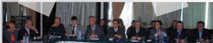
Дел од учесниците на конференцијата „Кооперативно здружување – основа за подобрување на конкурентноста на фармите“

ФФРМ и здруженијата на фармери и земјоделци на Балканот кои што преку дискусиите имаа можност да ги истакнат проблемите кои што најмногу ги засегаат, но и да разговараат за изнаоѓање на решенија на истите, како би го подобриле квалитетот на своето производство и би обезбедиле сигурен пласман на своите производи во Македонија и на Балканот.